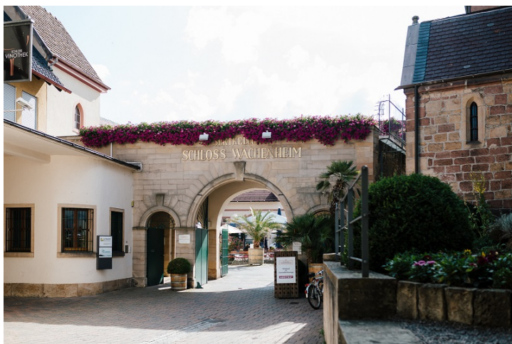
Kommerzienrat-Wagner-Straße 1, 67157 Wachenheim an der Weinstraße

Einen Besuch können wir leider nicht einrichten, würden uns jedoch gerne über moderne Postbearbeitung informieren. Vereinbaren Sie einen Termin mit uns.